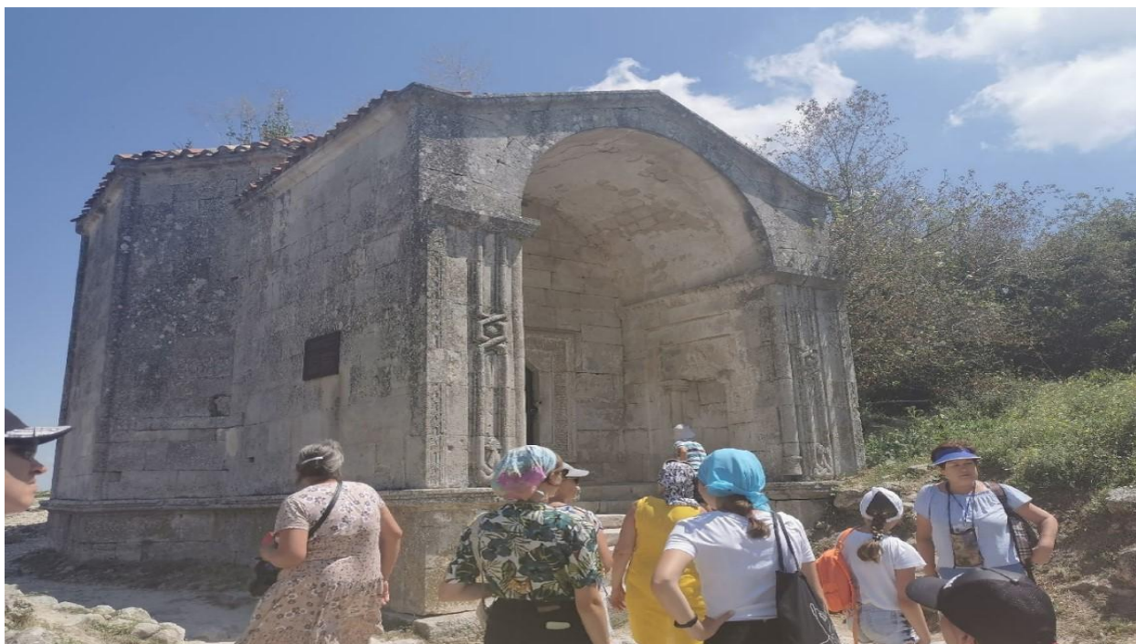
Рис. 7 Дюрбе Джанике

Конечно, нельзя не отметить потрясающие виды, которые открываются на вершине.