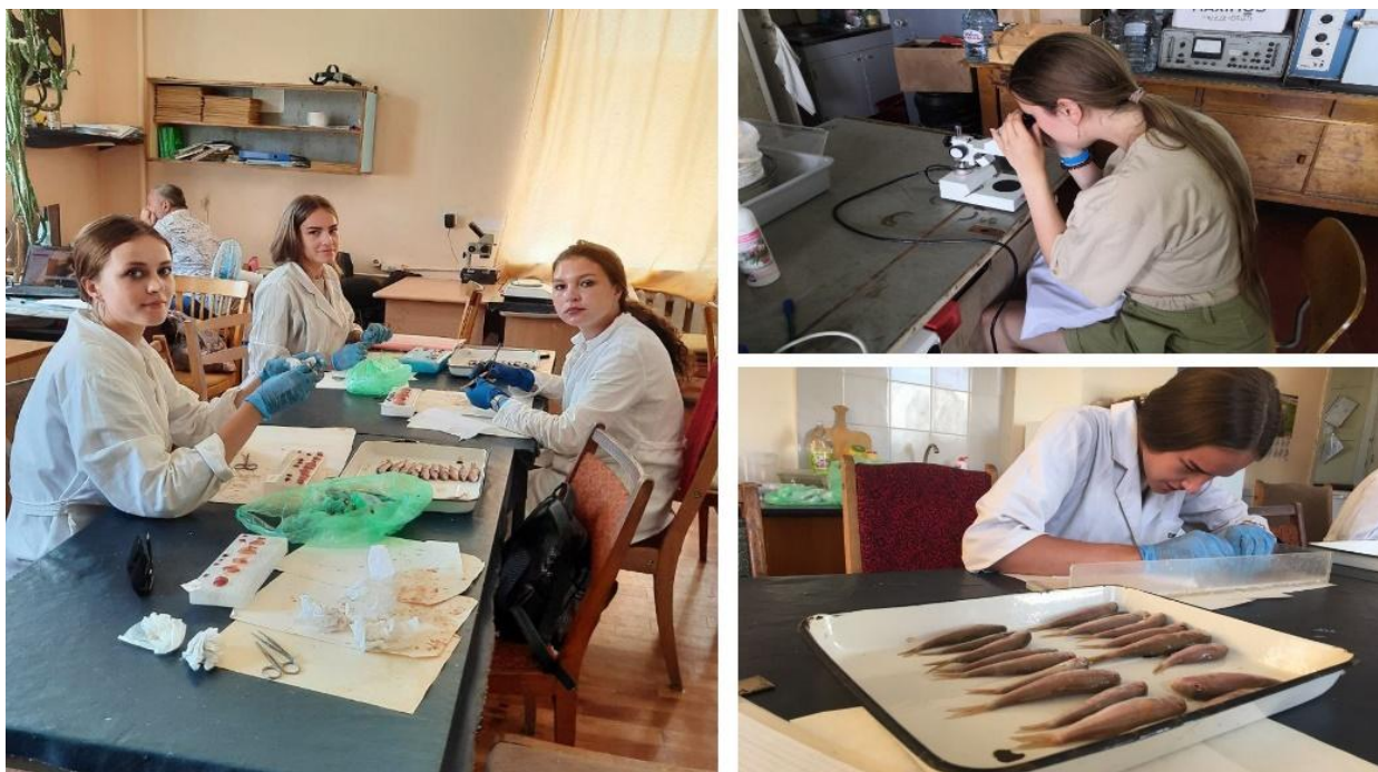
Рис. 4 Исследования образцов морской фауны

В течение следующих дней группы студентов трудились в своих отделах по распределению: подготавливали растворы для анализа полученных проб, исследовали образцы на дорогостоящем оборудовании, проводили эксперименты по влиянию выбросов водорослей цистозирры на ростовые параметры сельскохозяйственных культур. Студенты из другой группы начали изучение нового вида микроводорослей, из одного образца выращивая новую колонию. Также в бухте Омега измеряли уровень глюкозы и сердцебиения особей самого популярного обитателя Черного моря - морского ерша. Позже эти пробы были привезены в институт для изучения и контроля параметров рыбы.