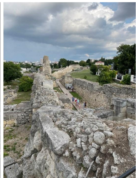
Рис. 10 Херсонес Таврический