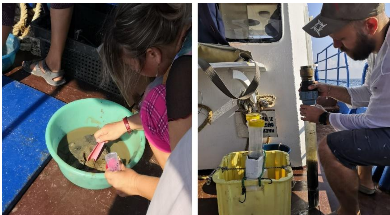
Рис. 3 Заборы проб грунта, воды и бентоса Черного моря

Вторая часть группы вышла в море вместе с сотрудниками института для выборки проб воды и грунта, чтобы анализировать динамику экологии моря. Мы освоили методику выборки проб, лично распределяли их по отсекам. В институте полученные образцы анализируются согласно специфике отделов.