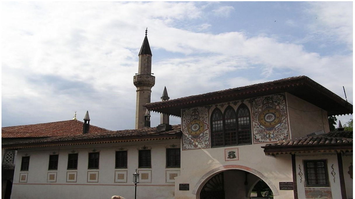
Рис. 9 Ханский дворец

Также мы всей группой посетили Государственный историко-археологический музей-заповедник «Херсонес Таврический». Херсонес был основан в 424—421 годах до н. э. В рамках экскурсии студенты смогли узнать историю образования города, принципы экономического устройства и уклада жизни граждан. Особое внимание было уделено центральной площади Херсонеса, Владимирскому собору и, конечно, античному театру, где на протяжении многих веков проводятся представления под открытым небом. В свободное от практики время нам посчастливилось посмотреть спектакль «Троянская война». Так как в представлении отражалось только начало этого события, было познавательно ознакомиться с дальнейшей хронологией самостоятельно.