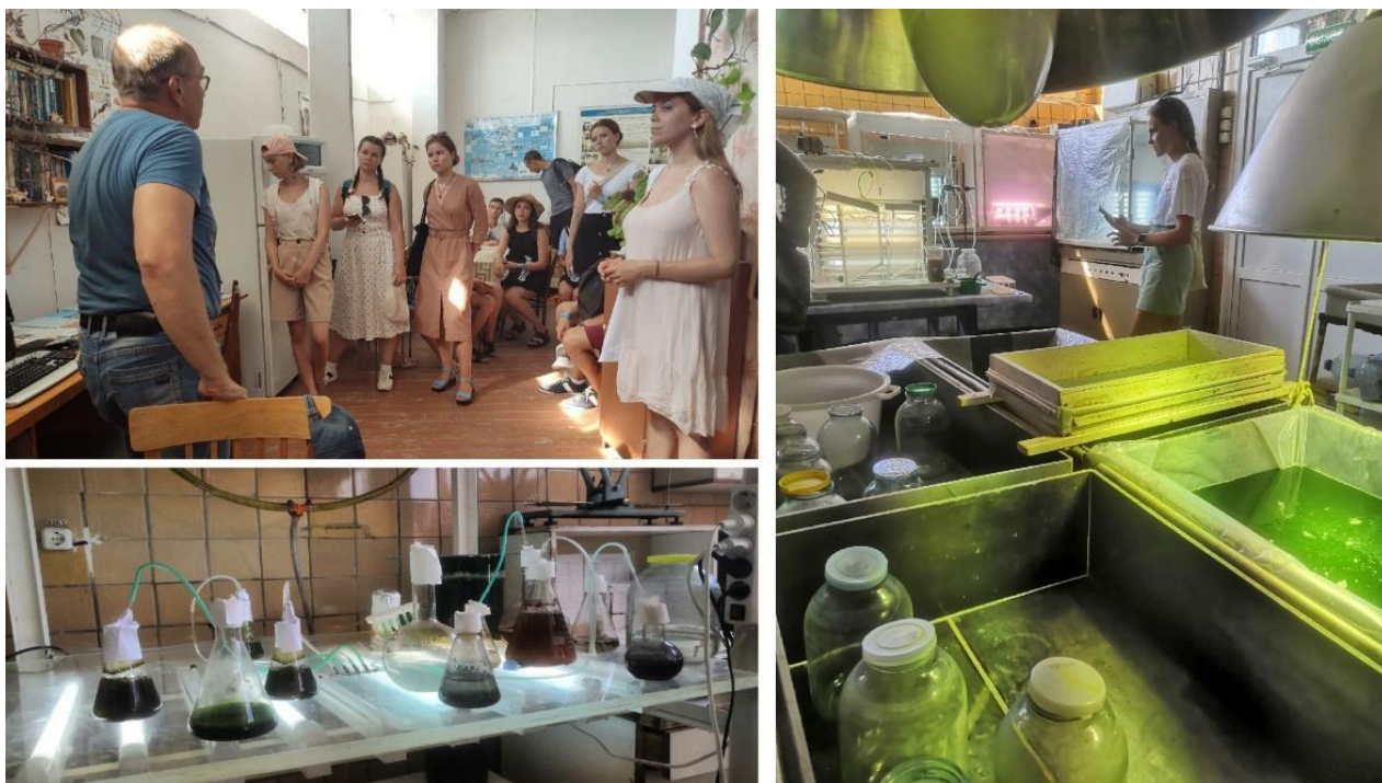
Рис.2 Выращивание микроводорослей

Основной частью практики стало проведение исследовательских работ на базе Института биологии южных морей им. А. О. Ковалевского, в котором мы поделились на группы согласно отделам. Одна часть студентов познакомилась с выращиванием микроводорослей и их спецификой.