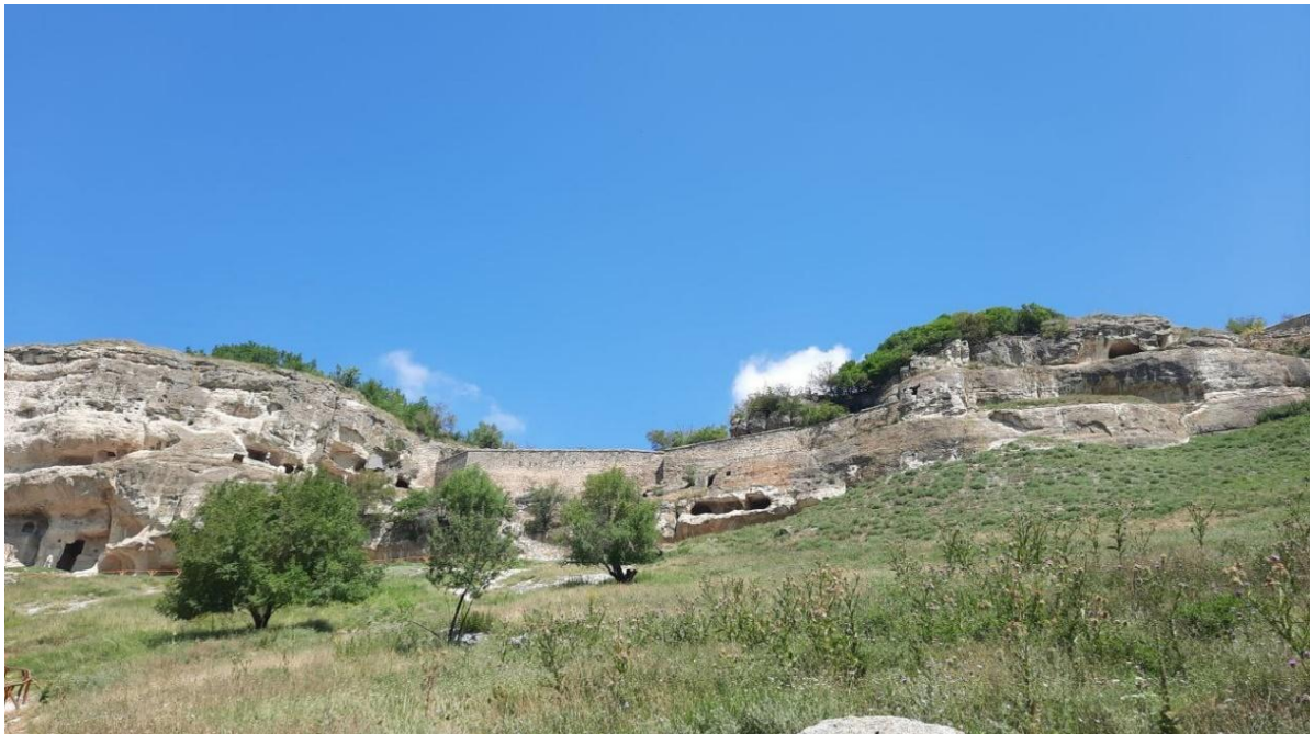
Рис. 6 Чуфут-Кале

Культурную программу практики мы продолжили в городе Бахчисарай. Группа посетила два знаменитых места: Чуфут-Кале и Ханский дворец. Первое - средневековый город-крепость, который является объектом культурного наследия народов РФ федерального значения.