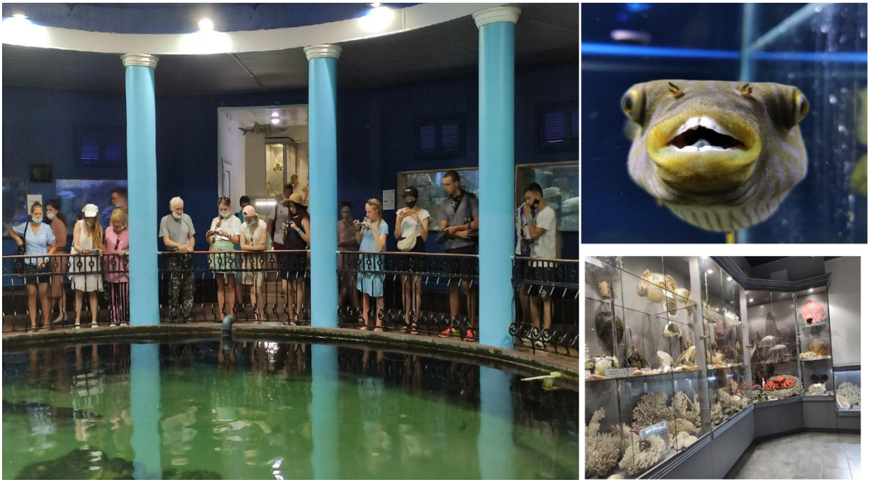
Рис.5 Севастопольский морской аквариум.

Культурную программу практики мы продолжили в городе Бахчисарай. Группа посетила два знаменитых места: Чуфут-Кале и Ханский дворец. Первое - средневековый город-крепость, который является объектом культурного наследия народов РФ федерального значения.